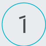
plate-forme d'imagerie biomédicale Cyceron